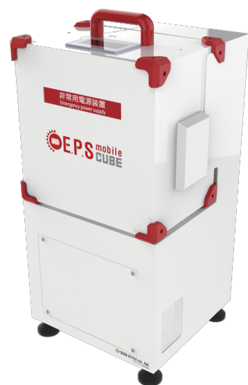
※写真は E.P.S mobile CUBE です