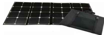
※E.P.S mobile CUBE は折畳式ソーラーパネル 100W 標準付属1枚