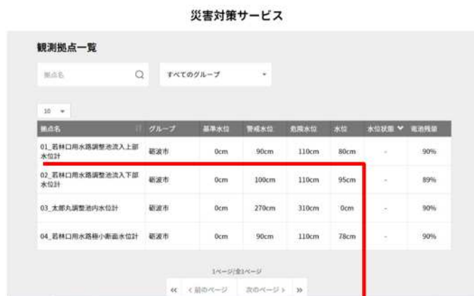
観測拠点一覧を表示