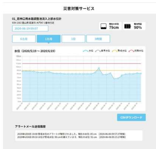
各観測拠点の水位状態をグラフで表示 (3時間、1日、1か月、6か月)