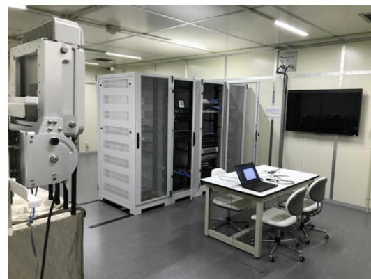
5G ラボ：シールドルーム内に ローカル 5G 無線機を設置（既設）