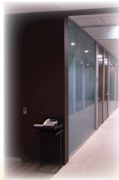
ハウスフォン (※アナログ電話機)